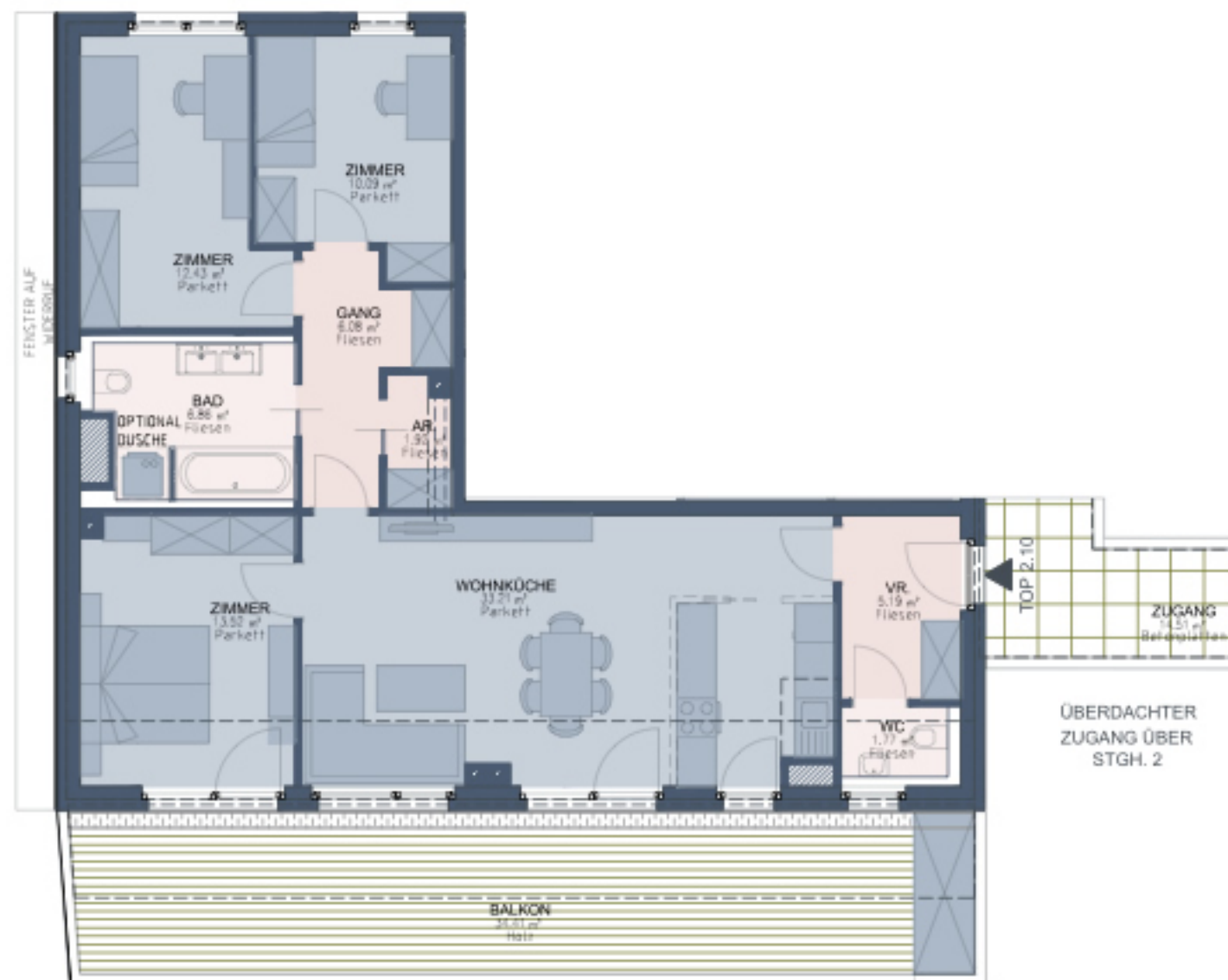
Südseitige 4-Zimmer Wohnung mit großem Balkon und Querdurchlüftung